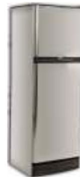
Revestimiento de heladeras