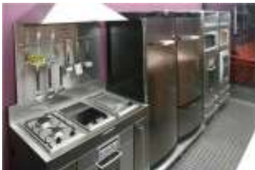
Tapa de cocinas