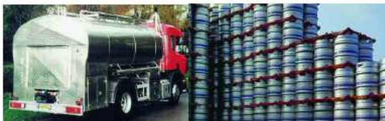
Tanques para transporte de leche/Barriles de cerveza