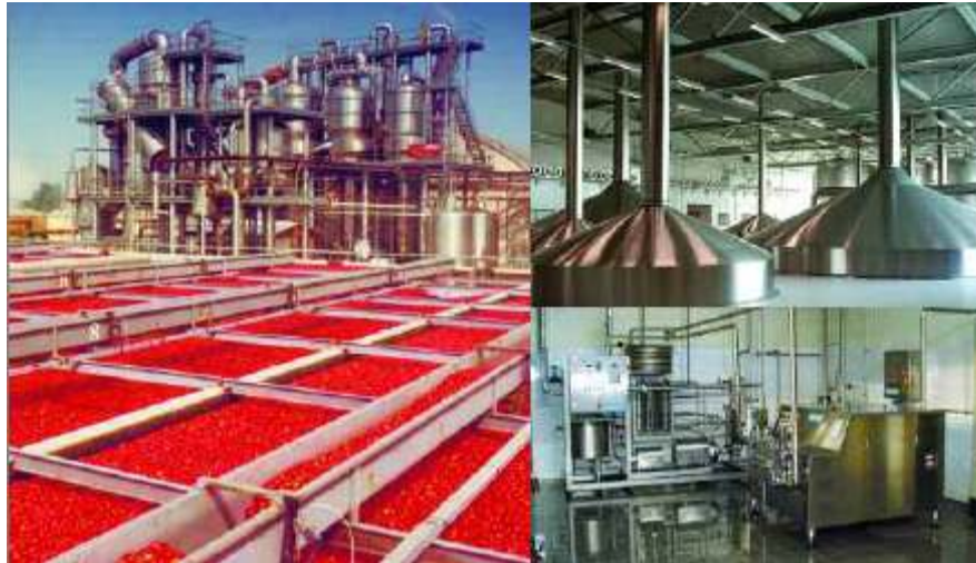
Procesamiento de tomates/Industria/Cocina industrial